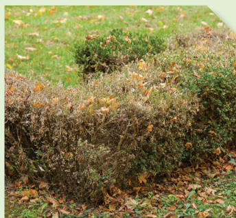
Défoliations causées par Cydalima perspectalis

Attirés par cette substance sémi chimique volatile, les mâles se retrouvent capturés dans le piège, ce qui empêche leur accouplement. Ainsi, le nombre de pontes et de futures chenilles diminuera.