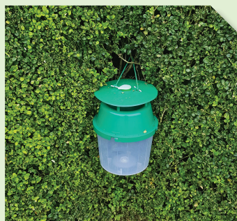
Piège Funnel contenant la phéromone BOX T PRO CAPS