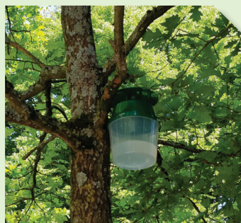
Piège Funnel contenant la phéromone OAK T PRO CAPS