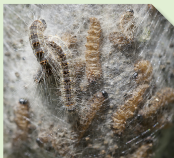
Thaumetopoea processionea sur le tronc d'un chêne

Attirés par cette substance sémiocchimique volatile, les mâles se retrouvent capturés dans le piège, ce qui empêche leur accouplement. Ainsi, le nombre de pontes et de futures chenilles diminuera.