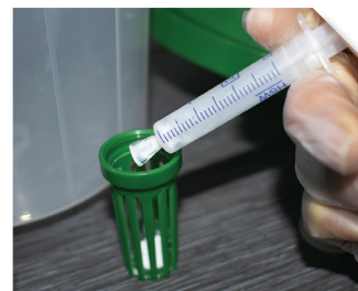
Application de OAK T PRO CAPS