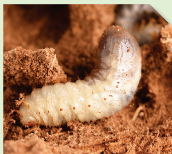
Larves de Rhynchophorus ferrugineus , qui se nourrissent des tissus végétaux

Attirés par ces substances sémiocchimiques volatiles, les charançons se retrouvent capturés dans le piège, ce qui empêche leur accouplement, entraînant la diminution du nombre de ponte et de futures larves.