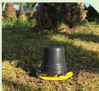
Piège Pitfall contenant la phéromone RHYNCHO PRO CLASSIC