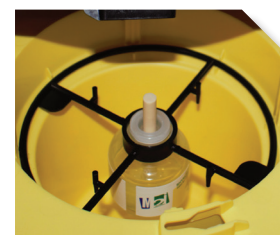
Application de RHYNCHO PRO CLASSIC