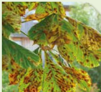
Brunissement rapide des feuilles causé par Cameraria ohridella

Attirés par cette substance sémi chimique volatile, les mâles se retrouvent capturés dans le piège, ce qui empêche leur accouplement. Ainsi, le nombre de pontes et de futures chenilles diminuera.