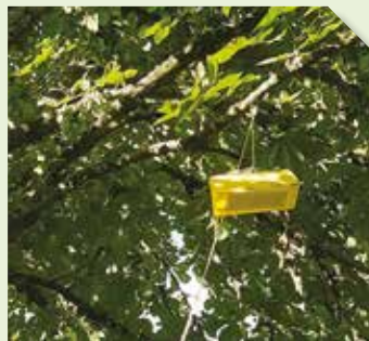
Piège Delta contenant la phéromone CAMERARIA PRO CAPS