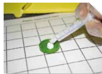
Application de CAMERARIA PRO CAPS