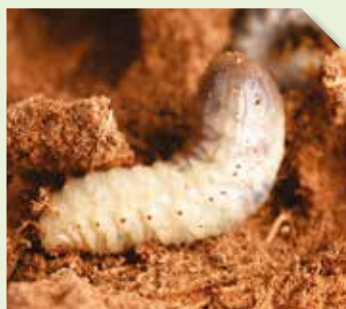
Larves de Rhynchophorus ferrugineus , qui se nourrissent des tissus végétaux

Attirés par ces substances sémiocchimiques volatiles, les charançons se retrouvent capturés dans le piège, ce qui empêche leur accouplement, entraînant la diminution du nombre de ponte et de futures larves.