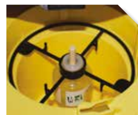
Application de RHYNCHO PRO CLASSIC