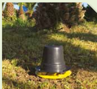
Piège Pitfall contenant la phéromone RHYNCHO PRO CLASSIC